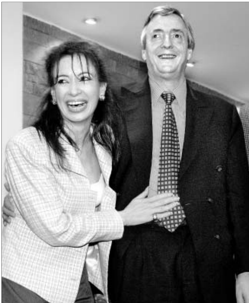
Néstor y Cristina Kirchner gozan de una elevada popularidad en Argentina.