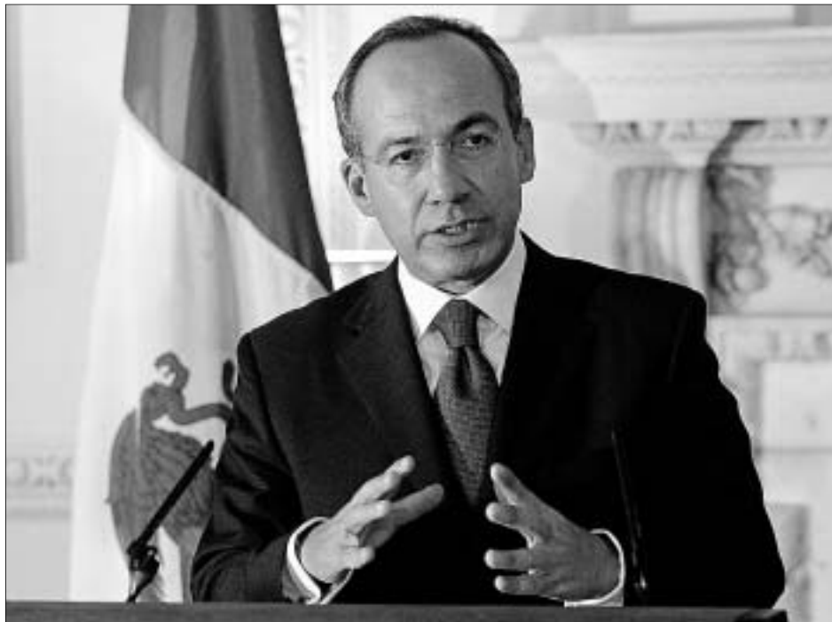
El presidente de México, Felipe Calderón.

Unas reformas que están dirigidas a fomentar el incremento de la inversión extranjera en el país, tal y como señaló la subsecretaria de Industria y Comercio de México, Rocío Ruiz, durante su intervención en la conferencia Los retos económicos del nuevo Gobierno de Felipe Calderón , del foro Iberoamérica Empre-