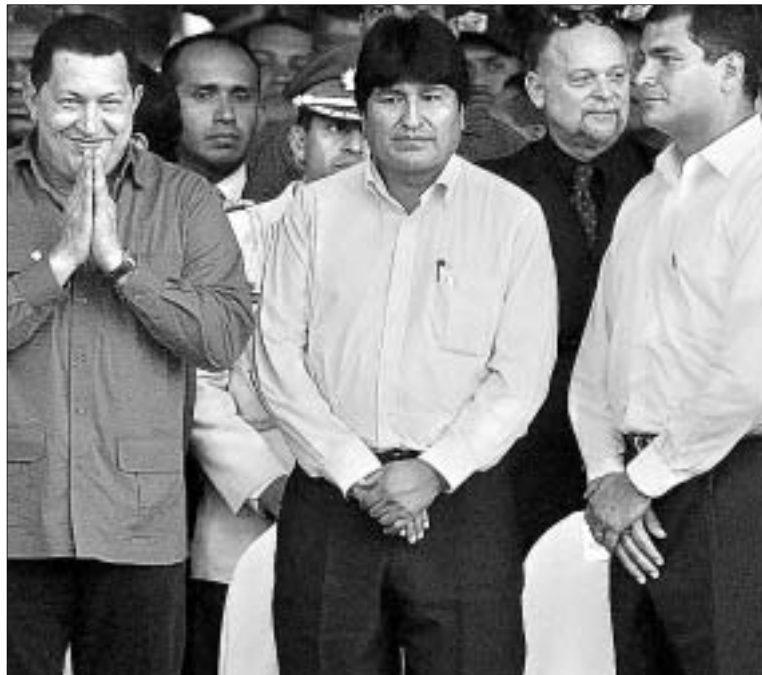
Hugo Chávez, Evo Morales y Rafael Correa quieren prolongar su mandato.

El caso más radical es Venezuela. Chávez está buscando a toda costa que se instituya la reelección indefinida. Para ello, estableció una comisión ejecutiva, subordinada a él bajo una confidencialidad absoluta, para redactar el proyecto de reforma constitucional que enviará a la Cámara Baja, donde la oposición no tiene ni un solo escaño. La situación es alarmante, pues el presidente posee un control hegemónico sobre el Congreso, el Tribunal Supremo de Justicia, el Consejo Nacional Electoral y las fuerzas militares. Esta tendencia autoritaria no es igual de fuerte en la mayoría de naciones latinoamericanas porque la alternancia en el poder sí está garantizada,