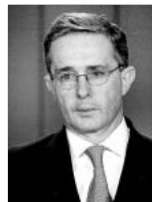
Álvaro Uribe.

El presidente de Colombia ganaría en la primera vuelta por mayoría absoluta, con el 57% de la intención de voto, según un sondeo de la firma Napoleón Franco, cuyo margen de error es del 3%. En segundo lugar, con el 19%, quedaría el ex magistrado y senador Carlos Gaviria Díaz, que aspira a la jefatura del Estado por la formación izquierdista Polo Democrático Alternativo (PDA).