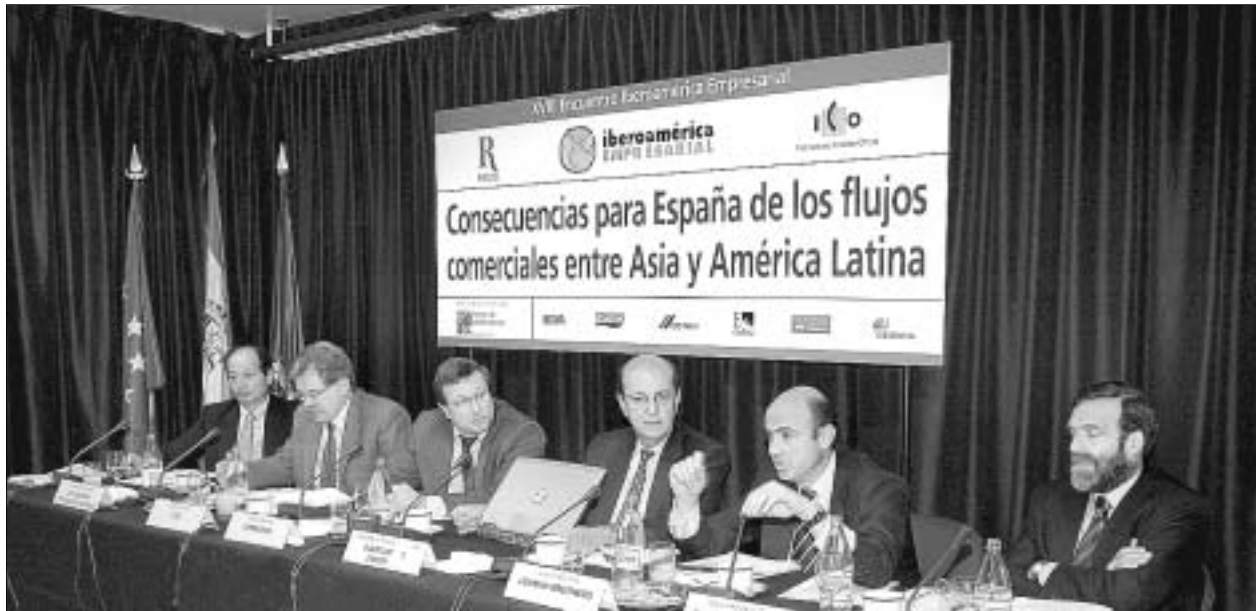
Los contertulios intervinieron en el debate 'Consecuencias para España de los flujos comerciales entre Asia y América Latina', en Madrid.

El economista comentó la evolución del precio de las materias primas, “que han crecido mucho en los últimos 24 meses”. En 2003-2004